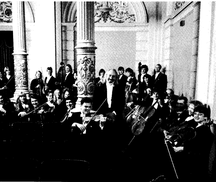
NIEUW SINFONIETTA AMSTERDAM / LEV MARKIZ